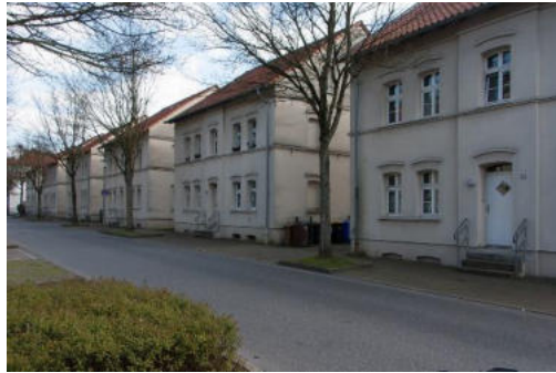
Von W.Strickling - Eigenes Werk, CC BY-SA 4.0, https://commons.wikimedia.org/w/index.php?curid=88449664