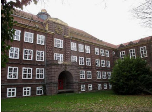
Von Dat doris - Eigenes Werk, CC BY-SA 4.0, https://commons.wikimedia.org/w/index.php?curid=65733701