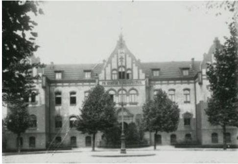
StA Gla_FA 22-29_ Berginspektion_Musikschule