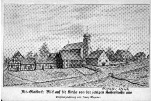
Zeichnung von Wegener 1880