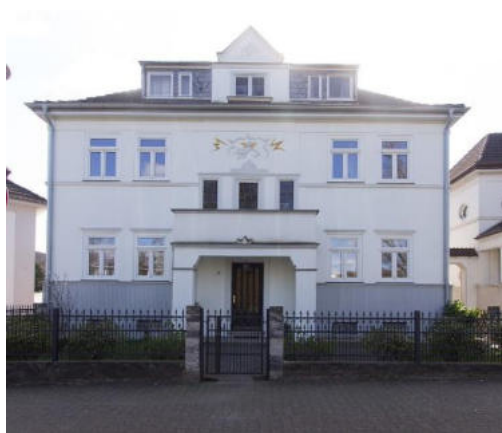
Von W.Strickling - Eigenes Werk, CC BY-SA 4.0, https://commons.wikimedia.org/w/index.php?curid=88449651