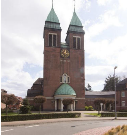
Von W.Strickling - Eigenes Werk, CC BY-SA 4.0, https://commons.wikimedia.org/w/index.php?curid=88449672