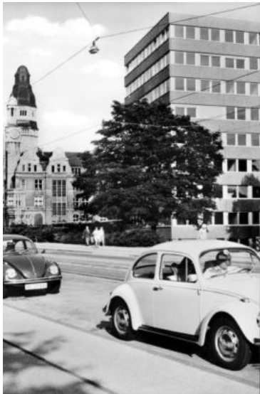
0144 Bürotürme ca 1995