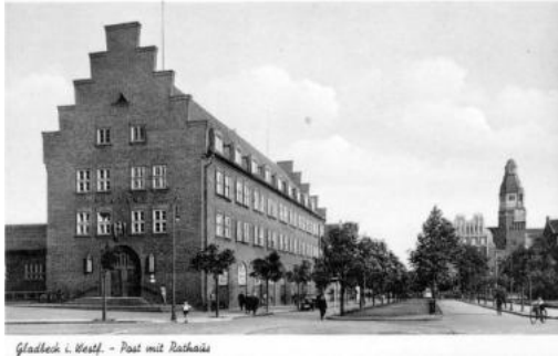
Gruß aus Gladbeck