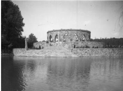
StA Gla_FA 31-8_Ehrenmal

Die Einweihung des neuen Ehrenmals erfolgte mit großem Pomp am 17.6.1934.